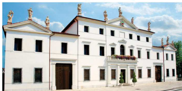
Sede amministrativa Domovip Italia srl Palazzo Carraro, prima Menegozzi - Brazzoduro Piazza Duomo, 18 - Aviano (PN)